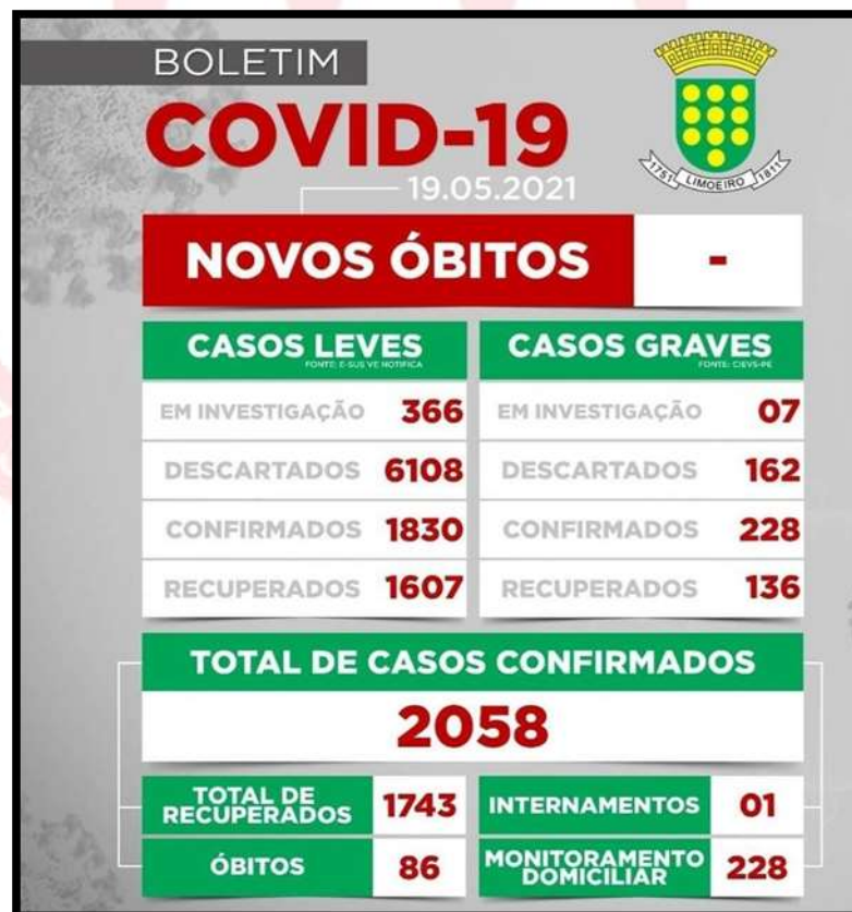
IMAGEM 01. Boletim Epidemiológico COVID-19. Limoeiro-PE, 2021.

A II Regional de Saúde , no dia 19 de maio de 2021, confirmou 20.065 casos na plataforma do CIEVS-PE, destes, 1.902 são casos graves e 1.8163 casos leves. Limoeiro até o dia 19 de maio registrou 1.830 casos leves e 228 casos graves, totalizando 2.058 casos confirmados laboratorialmente da doença. Até o momento, são registrados 86 óbitos por COVID-19.